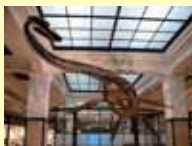
国立科学博物館常設展示

植物園の他、国立科学博物館常設展 示〔600円〕(上野)や自然教育園 〔300円〕も1年間何回でも無料で見 学可。即日発行、植物園の受付で入 会できます。