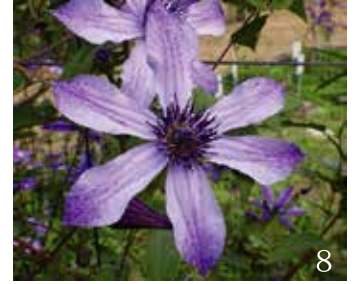
(写真 1. カザグルマ千葉県産 2. カザグルマ静岡県産 3. マダム・ジュリア・コレボン 4. ベルル・ダジュール 5. コンテス・ド・ブーシヨ 6. かぐや 7. はやて 8. 流星)