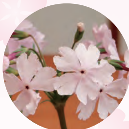
園芸品種 「薄蛇の目」