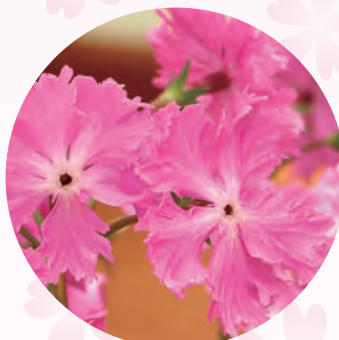
園芸品種「美女の舞」