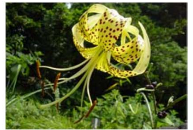
オウゴンオニユリ

✿水辺ではハンゲショウの葉が開花に合わせて白く変わり、砂礫地ではカワラサイコが群落を作ります。岩礫地ではオオバギボウシが涼しげな花を咲かせ、山地草原ではチダケサシがかわいい花穂をゆらしませます。