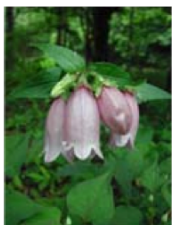
ヤマホタルブクロ